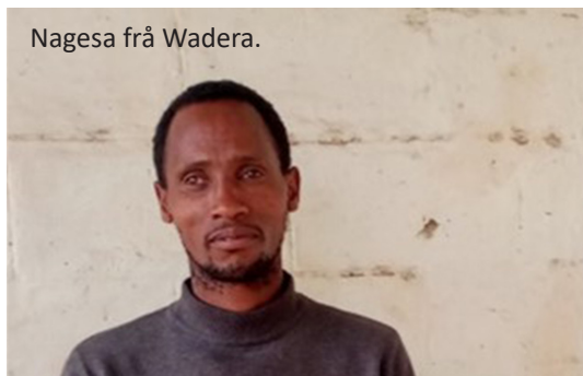
Nagesa frå Wadera.