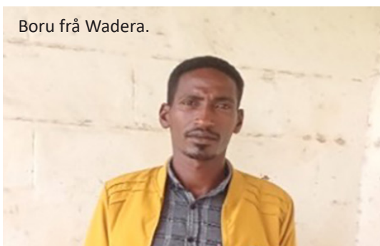
Boru frå Wadera.

Nå er situasjonen noko liknande i Adola-Genale Synoden. Leiarane ber oss om hjelp til kunne utruste folk til teneste.